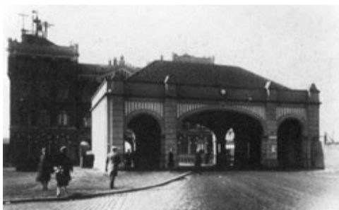
Het kleine Poortgebouw (1929).

Kort na het voltooiën van het 'grote' Poortgebouw komt een klein model poortgebouw